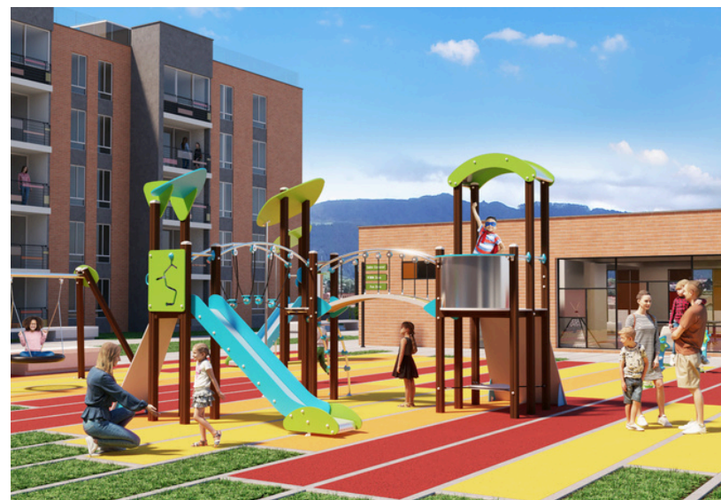
Parque Infantil y Zonas Verdes