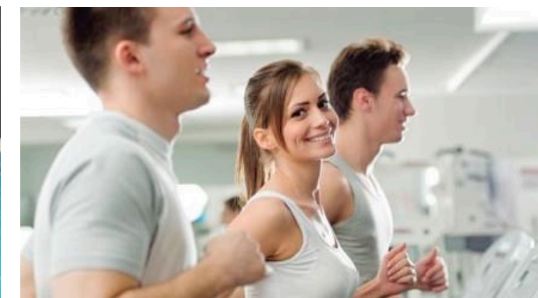
Zona de Gimnasio

*Las imágenes, renders, planos, diseños, acabados, dimensiones, distribuciones, mobiliario, colores y demás elementos presentados son representaciones artísticas referenciales y están sujetos a cambios sin previo aviso. La información aquí suministrada, es de carácter ilustrativo y no constituye una oferta vinculante ni contractual. Las áreas, medidas y características definitivas del proyecto estarán determinadas en los planos aprobados por las autoridades competentes y en el contrato correspondiente. El mobiliario, equipamiento y elementos decorativos mostrados no están incluidos.